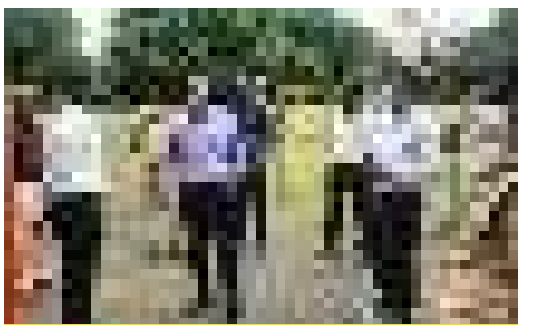
कलेक्टर तथा पुलिस अधीक्षक ने लिया समारोह स्थल का जायजा

स्वतंत्रता दिवस के मुख्य आयोजन स्थल पर प्रशासनिक अमले द्वारा संपूर्ण तैयारियां पूर्ण कर ली गई हैं। इसके पहले 13 अगस्त