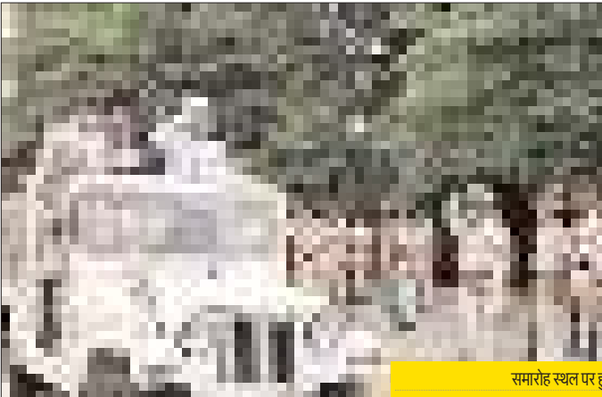
समारोह स्थल पर हुआ परेड का पूर्वायस।

शहर की शैक्षणिक संस्थाओं में भी बच्चों को नहीं बुलाया जाएगा। संस्था के प्रमुखों व स्टाफ के लोगों द्वारा ध्वजारोहण किया जाएगा। स्कूलों पर भी किसी तरह के सांस्कृतिक कार्यक्रम नहीं होंगे। मगर कई संस्थाएं वर्चुअल आयोजन करेंगी। संस्थाओं के शिक्षक बच्चों से विडियो एप के जरिए जुड़ेंगे और कई तरह की गतिविधियों व प्रतियोगिताओं का आयोजन किया जाएगा। जिसमें रंगोली, फैंसी ड्रेस, वाद-विवाद प्रतियोगिता, भाषण प्रतियोगिता आदि कई तरह के आयोजन होंगे।